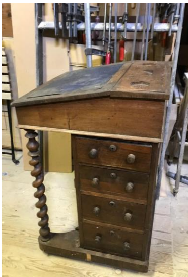
Bureau Davenport en cours de restauration