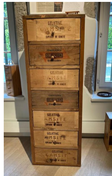
Commode faite avec les caisses d'explosifs du barrage du Grimsel Dimensions : H 134 ; L 38 ; P 42 cm