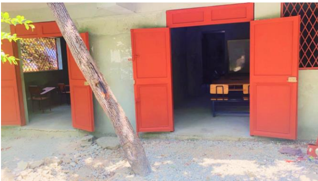
...et APRÈS la réalisation des portes et fenêtres, avec fers forgés