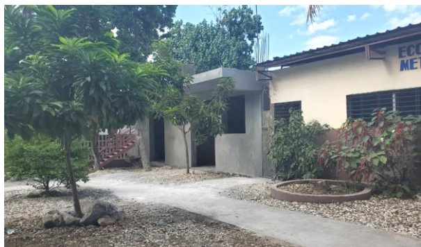
Le bâtiment actuel et l'extension construite pour abriter le laboratoire informatique

Hors, l'achèvement du laboratoire informatique revêt une importance capitale pour l'institution, car il permettra de doter les élèves de compétences techniques essentielles dans un monde de plus en plus dominé par les technologies de l'information. Cependant, sans le soutien financier nécessaire, ce projet reste à l'arrêt, compromettant ainsi les efforts de l'école pour offrir une formation moderne et de qualité à ses étudiantes et étudiants.