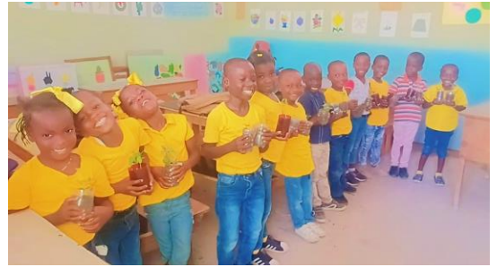
Plantules en main, prêts à aller au jardin !

élèves se sont montrés très intéressés par le terrain du jardin scolaire. Dès lors, l'école a instauré quelques heures dans leur programme hebdomadaire pour que les élèves puissent acquérir des connaissances en agriculture. Les petites classes visitent le jardin pendant que les grands s'occupent d'arroser et de planter sous la direction d'un expert agricole. À la demande des élèves et des parents, l'agent agricole aide à la réalisation de petits jardins individuels.