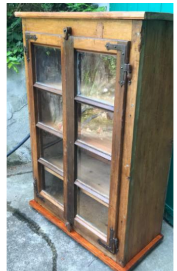
Vitrine réalisée avec une fenêtre du 18 e siècle, trouvée à Cara

Côté meubles, il y a des nouveautés : une commode à rideau avec 10 tiroirs, une vitrine en vieux noyer, une autre fabriquée avec une fenêtre du 18 e trouvée à Cara et un bureau Davenport.