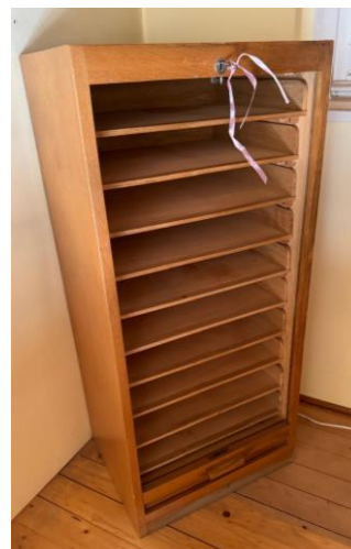
Commode à rideau avec 10 tiroirs