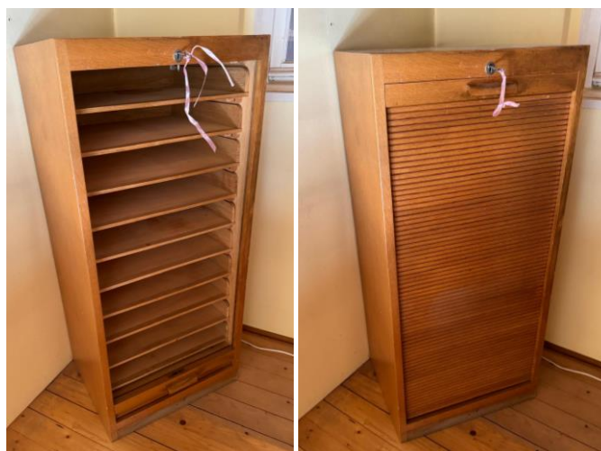
Commode à rideau avec 10 tiroirs