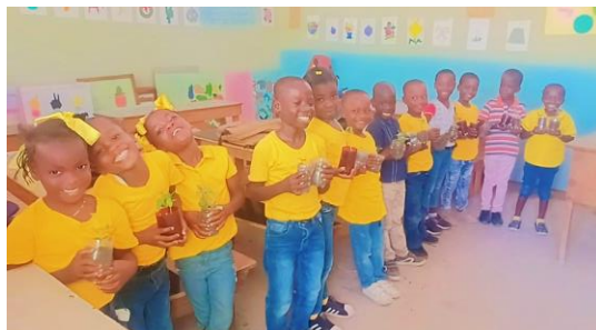
Plantules en main, prêts à aller au jardin !

L'école a inclus les parents et les enseignants dans ce projet innovant. Ils ont contribué à la préparation du terrain et amener des semences de toutes sortes. Les élèves se sont montrés très intéressés par le terrain du jardin scolaire. Dès lors, l'école a instauré quelques heures dans leur programme hebdomadaire pour que les élèves puissent acquérir des connaissances en agriculture. Les petites classes visitent le jardin pendant que les grands s'occupent d'arroser et de planter sous la direction d'un expert agricole. À la demande des élèves et des parents, l'agent agricole aide à la réalisation de petits jardins individuels.