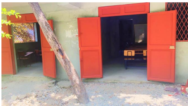
...et APRÈS la réalisation des portes et fenêtres, avec fers forgés