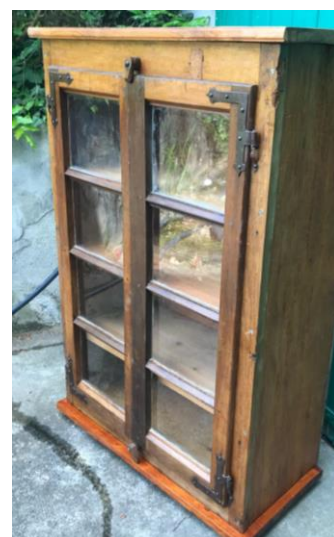
Vitrine réalisée avec une fenêtre du 18 e siècle, trouvée à Cara

Côté meubles, il y a des nouveautés : une commode à rideau avec 10 tiroirs, une vitrine en vieux noyer, une autre faite avec une fenêtre du 18 e trouvée à Cara et un bureau Davenport.